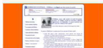
Informagiovani - Italia