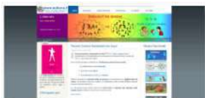
Bullismo? No Grazie!