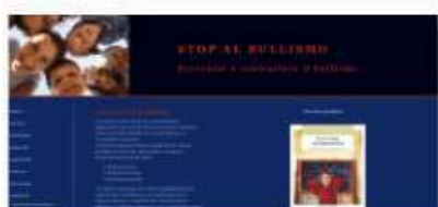
STOP al Bullismo