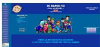
Aquilone Blu ONLUS