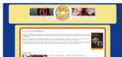
SMONTA IL BULLO