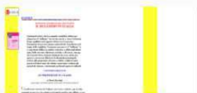
Bullismo in Italia